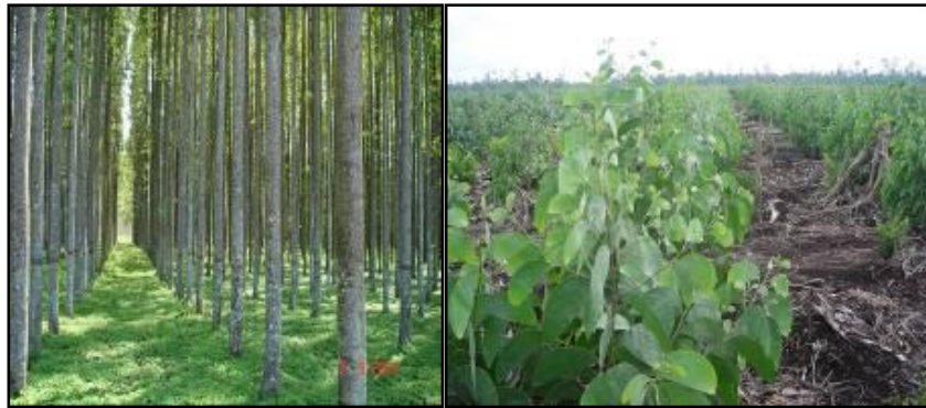
Gambar 1. Jenis Tanaman di Konsesi PT. Arara Abadi

Berdasarkan kondisi biofisik lahan/ areal kerja, PT. Arara Abadi terbagi dalam dua jenis sebaran tanah, yaitu tanah mineral dan tanah rawa gambut. Mengacu pada hasil riset yang telah dilakukan oleh R&D PT. Arara Abadi, perusahaan untuk melakukan pengembangan jenis Eucalyptus sp di areal tanah mineral dan jenis Acacia crassicarpa di tanah rawa gambut. Pemilihan kedua jenis tanaman tersebut karena faktor tingginya tingkat resistensi terhadap hama dan penyakit dan mempunyai riap, serta rendemen pulp lebih tinggi.