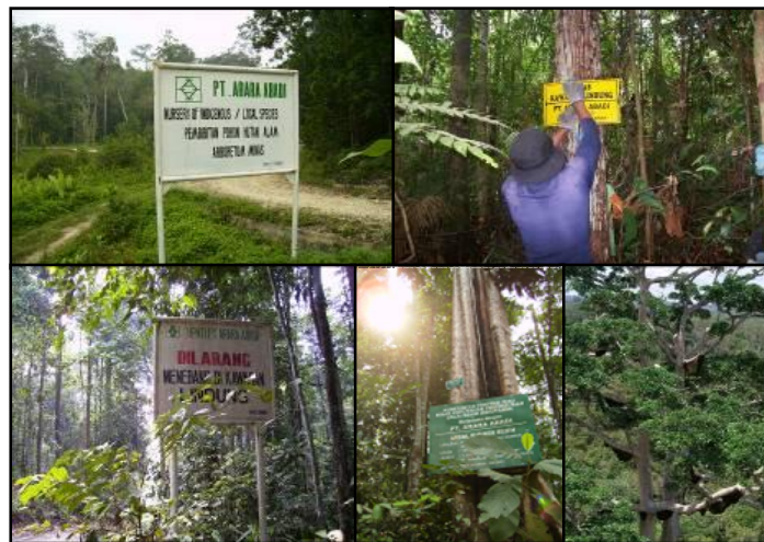
Gambar 5. Kegiatan Pengelolaan Kawasan Lindung PT. Arara Abadi

Nutfah (KPPN), Arboretum, dan Daerah Pengungsian Satwa Liar (DPSL). Total areal PT. Arara Abadi yang di alokasikan sebagai areal kawasan lindung seluas 36.820 Ha. Kegiatan pengelolaan kawasan lindung yang telah dilakukan adalah pemasangan batas, pemasangan papan peringatan, pengayaan atau penanaman untuk kegiatan rehabilitasi, inventarisasi dan identifikasi flora dan fauna, serta kegiatan patroli pengamanan kawasan lindung.