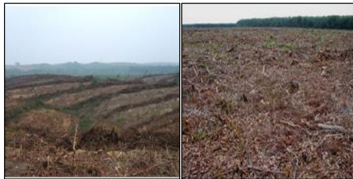
Gambar 3. Kegiatan PLTB (Sistim Buka Jalur Mekanis dan Spreading )