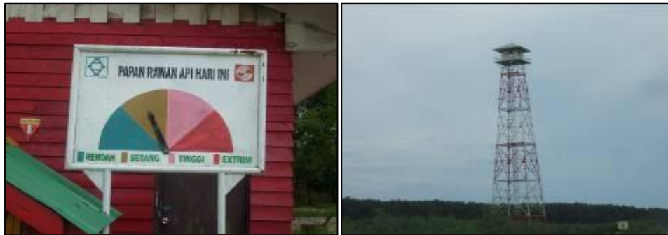
Gambar 4. Papan Indeks Bahaya Kebakaran & Menara Pemantau Api